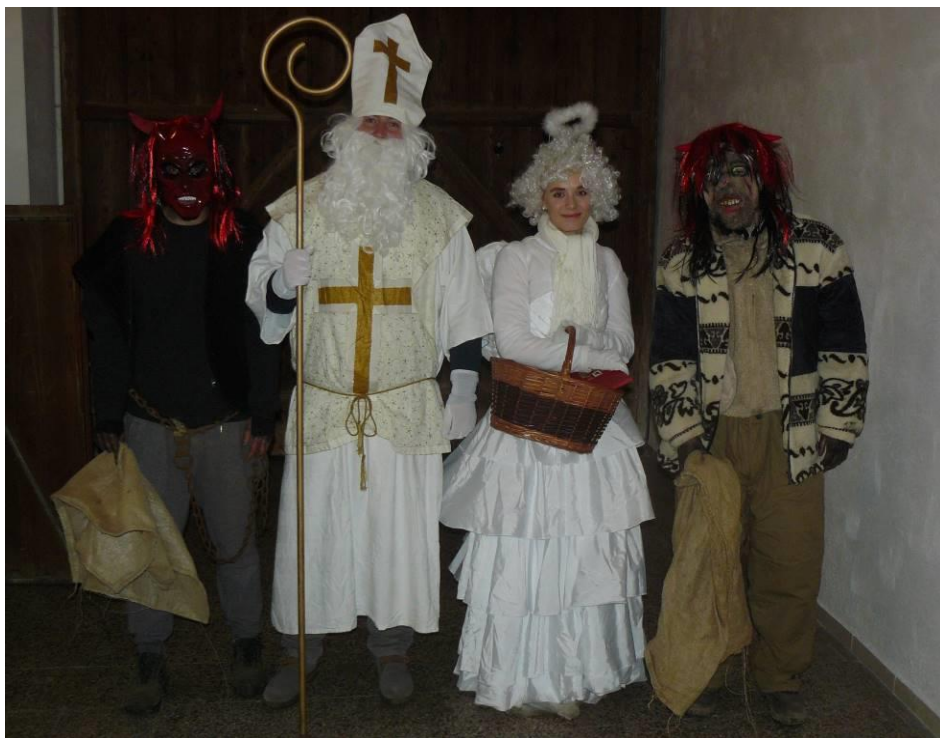
Mikuláš s andělem a čerty ve Světlé - 5. prosince 2020

d) Atelier Naskok předložil k připomínkám předběžný návrh architektonické studie řešení areálu pod lipami pod názvem Aktivní park obce Světlá. K této studii byla dne 24. 10. 2020 svolána pracovní porada zastupitelů i uživatelů areálu. Vznesené připomínky byly písemně postoupeny zpracovatelské firmě.