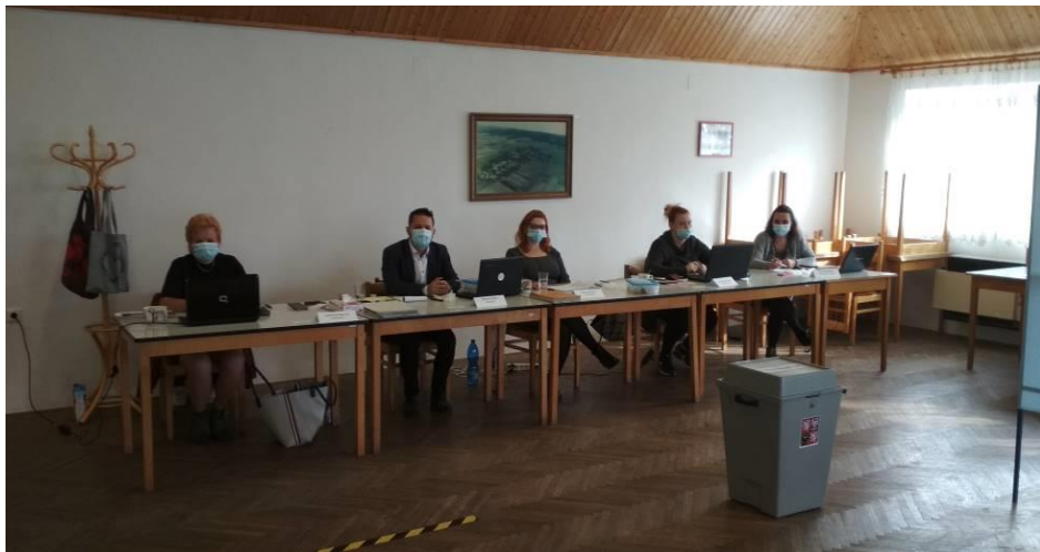
Volby do krajského zastupitelstva ve Světlé - 2. a 3. října 2020

g) Starosta informoval zastupitele o vývoji jednání o odkupu „kašny“ nad obcí.