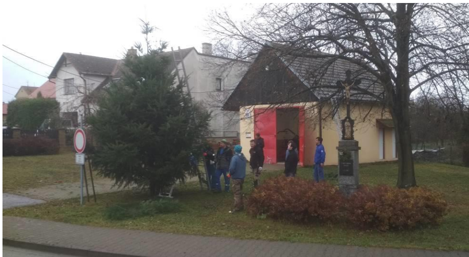
Stavění vánočního stromu ve Světlé - 28.11.2020

přecházejících k našemu svazku neustále roste a nedávno jsme přijali mezi sebe padesátou obec. Za asi tříletou existenci jsme získali velké množství dotačních prostředků v řádu desítek milionů korun, a to především na pořízení nákladních vozidel a sběrných nádob pro obec. Situace v oblasti odpadů se ale komplikuje a výhledově bude stále obtížnější hledat odběratele na jednotlivé druhy odpadu. S tím souvisí i nevyhnutelný růst nákladů na odpadové hospodářství, i když se zároveň postupně zvyšují i odměny od firmy Ekokom za třídění odpadů. Po diskuzi se starosty okolních obcí ale mohou konstatovat, že výše poplatku za odvoz a likvidaci odpadů ve Světlé patří k nejnižším (a to podotýkám, že poplatek u nás vychází z reálných nákladů na tuto agendu). Z toho plyne, že odpady v naší obci zřejmě řešíme dobře.