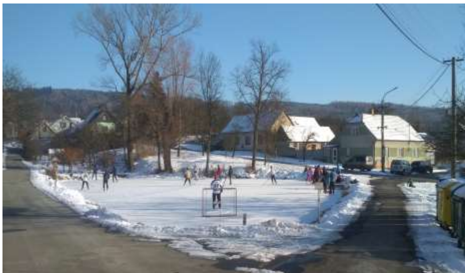
Zimní sporty a radovánky na horním rybníku (únor)