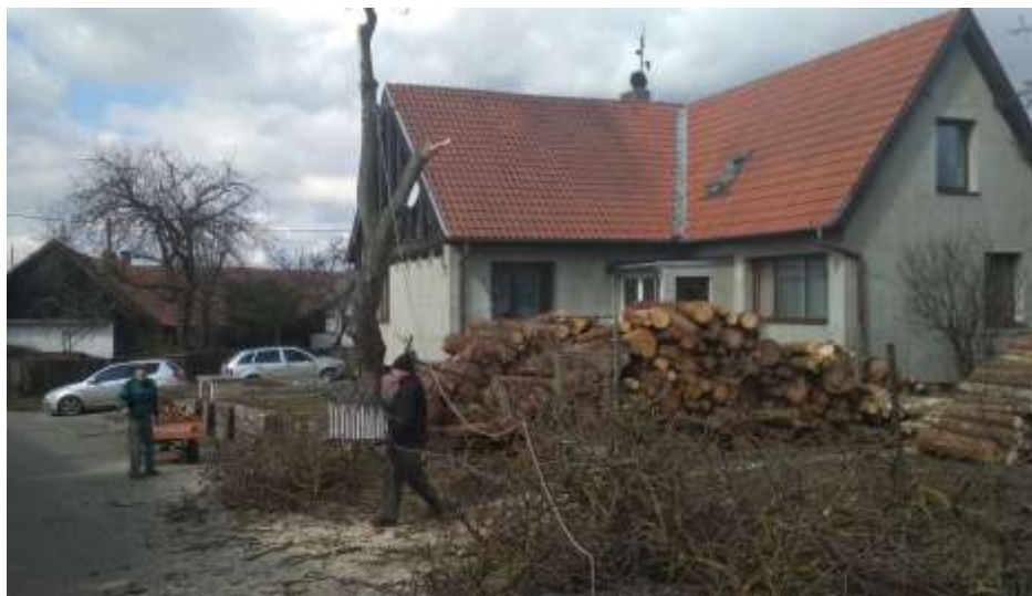
Kácení ořechu u Letfusů (březen)