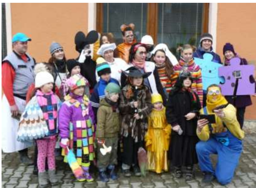
Masopust 2016, letos se bohužel kvůli protiepidemiologickým opatřením konat nemohl