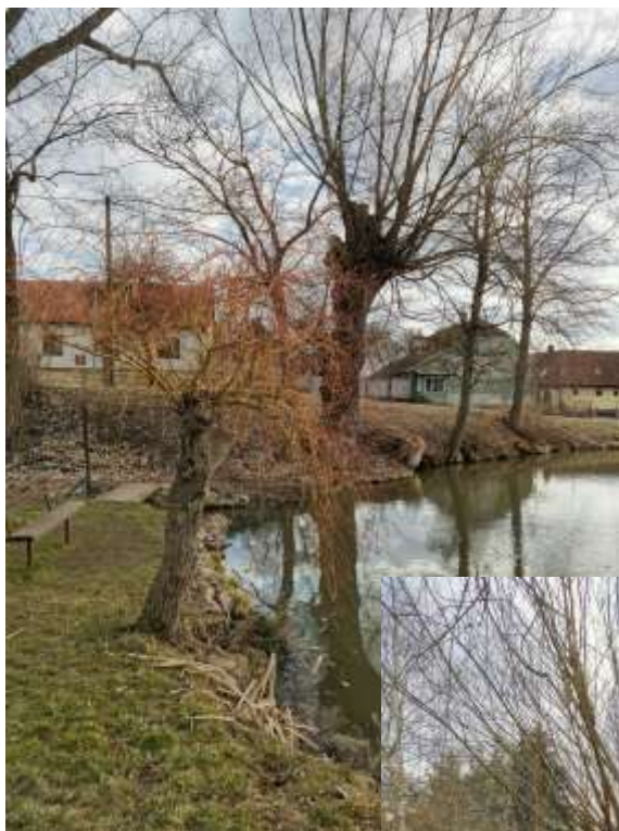
Vrba kroucená u horníku rybníku