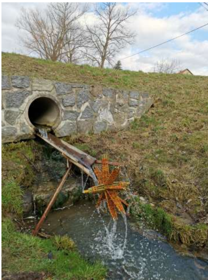
Mlýnek pod horním rybníkem