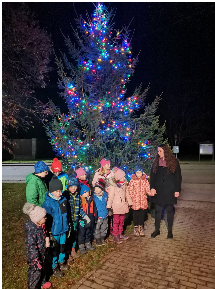
Rozsvícení vánočního stromu - 27. 11. 2022