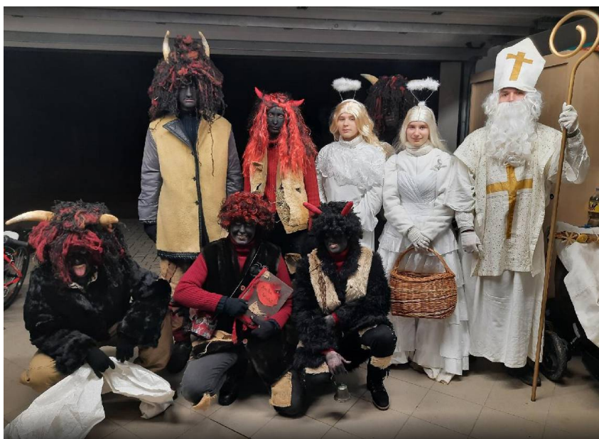
Mikuláš s anděly a čerty - 4. 12. 2022