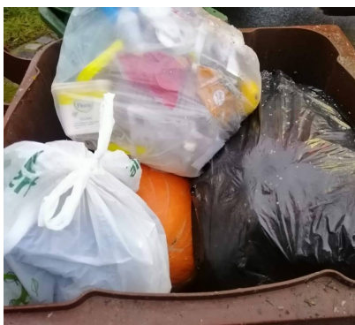
Sem patří bioodpad!

Děkujeme, že třídíte, chováte se zodpovědně a máte pozitivní přístup!