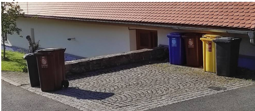
Správně připravené nádoby ke svozu

dívat se, zda je nádoba plná či nikoliv. Je třeba přistavit nádoby vždy co nejdříve k cestě, kde jezdí technika.