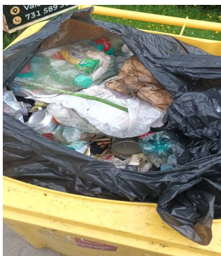
Ve žluté směsný komunální odpad!