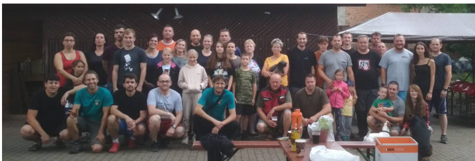
Voda koňkó přes tři kraje - Úsobrno - 3. 9. 2022