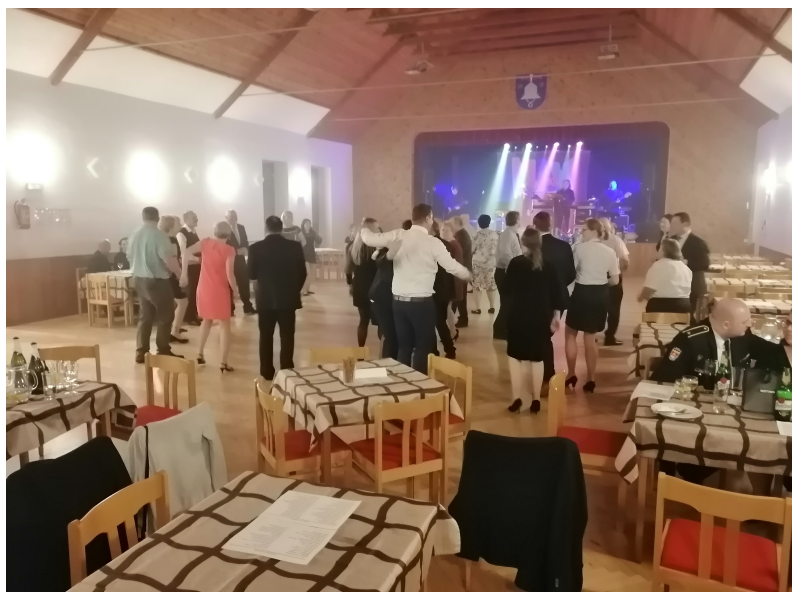
Po covidové odmlce se 7. ledna uskutečnil již 14. Společenský ples SDH Světlá.