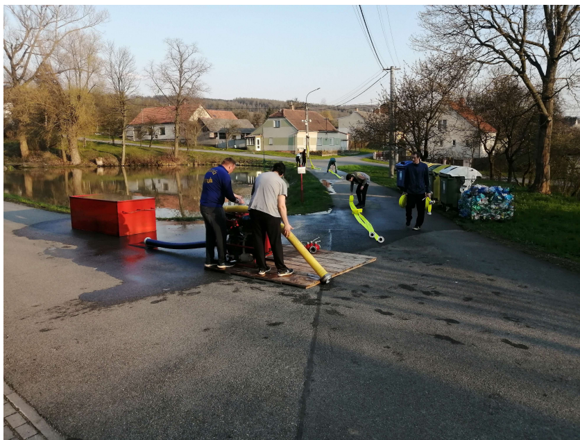
Nácvik požárního útoku ve Světlé u rybníku před sobotní soutěží.