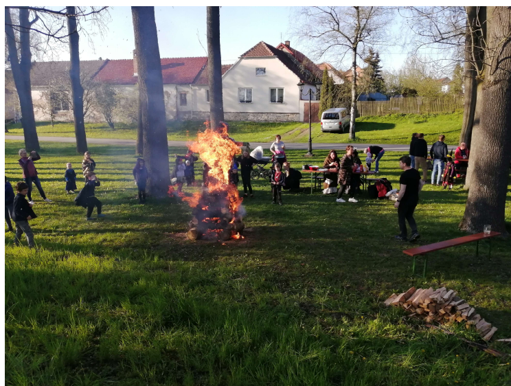
Pálení čarodějnic na výletišti ve Světlé - 30.4.2023