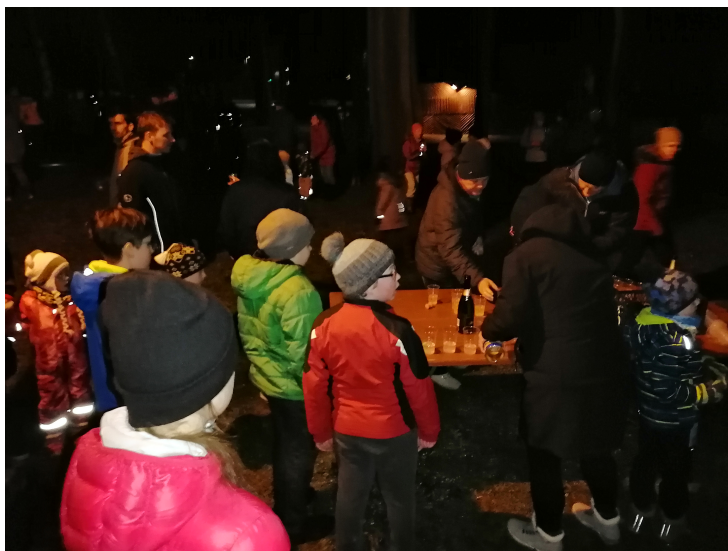
Novoroční přípitek v areálu místního vyletiště.