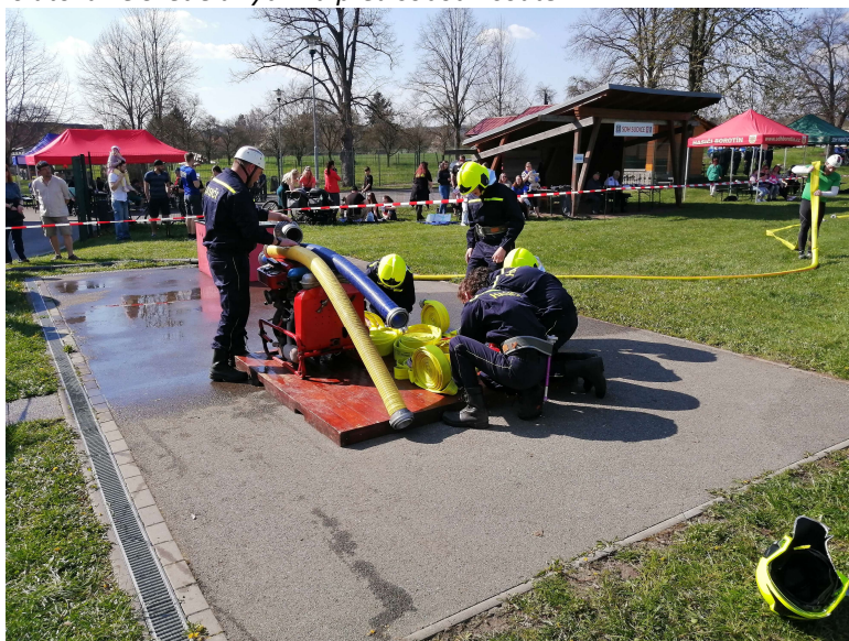
Okrsková soutěž hasičů konaná 22.4.2023 v Sudicích - SDH Světlá před pož. útokem