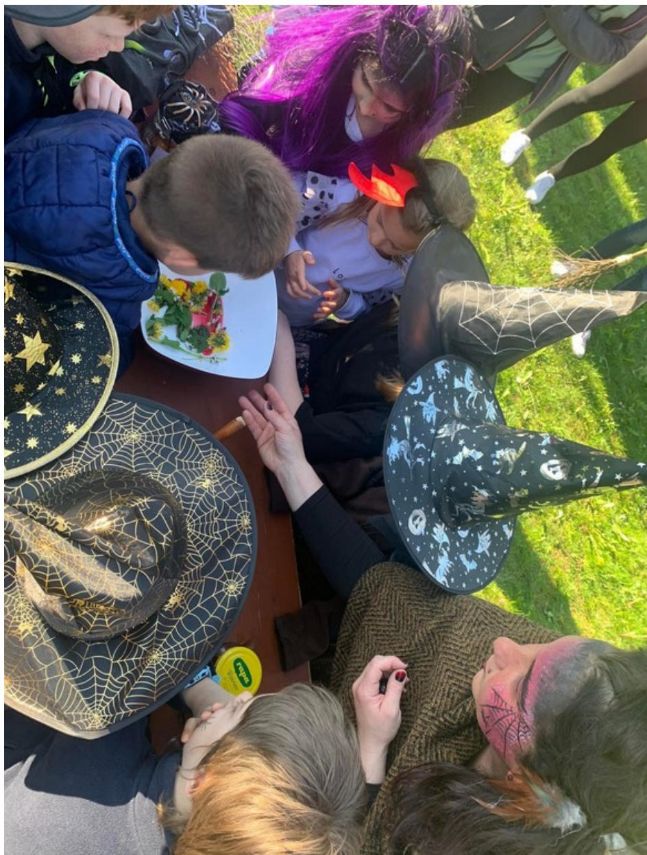
Vaření čarodějného lektvaru