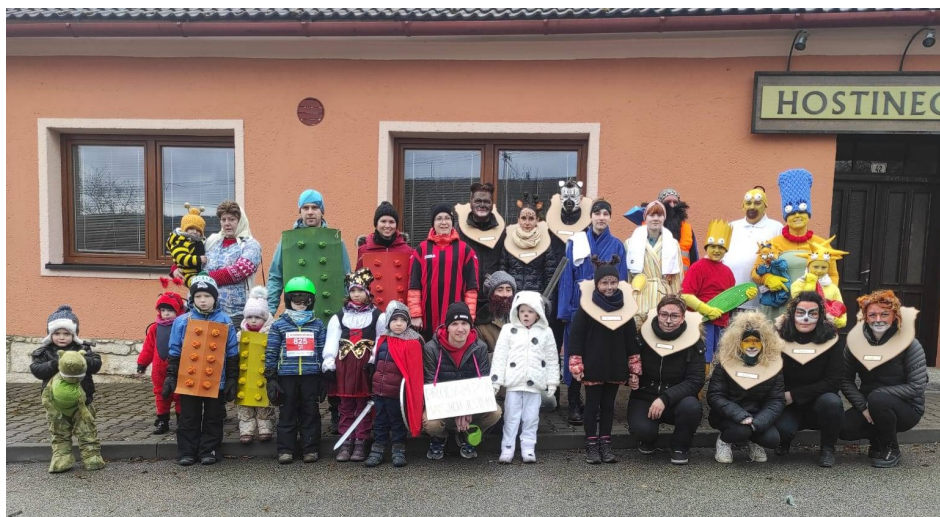
Tradiční masopustní průvod obcí - únor 2023