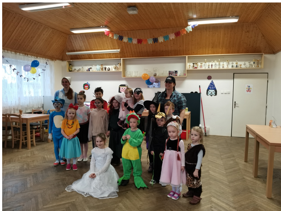
Dětský karneval v sále kulturního domu - březen 2023