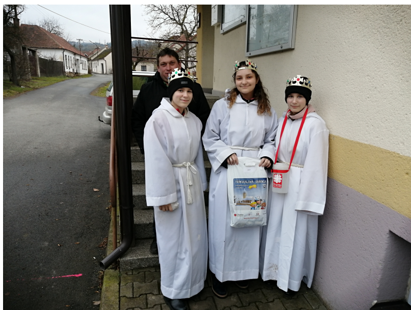
Tříkrálová sbírka (8. 1.) - letos bylo v obci Světlá vybráno celkem 8.917 Kč, děkujeme.