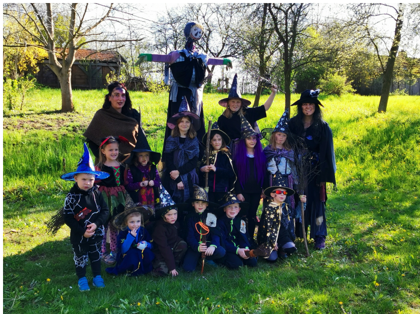
Tradiční pálení čarodějnic - 30. 4. 2023