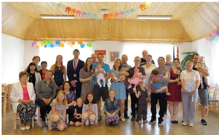
Vítání občánek v sále kulturního domu ve Světlé (18. 6. 2023)