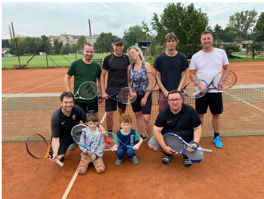
Tenisové dopoledne světelských tenistů ve Velkých Opatovicích (3. 8. 2023)