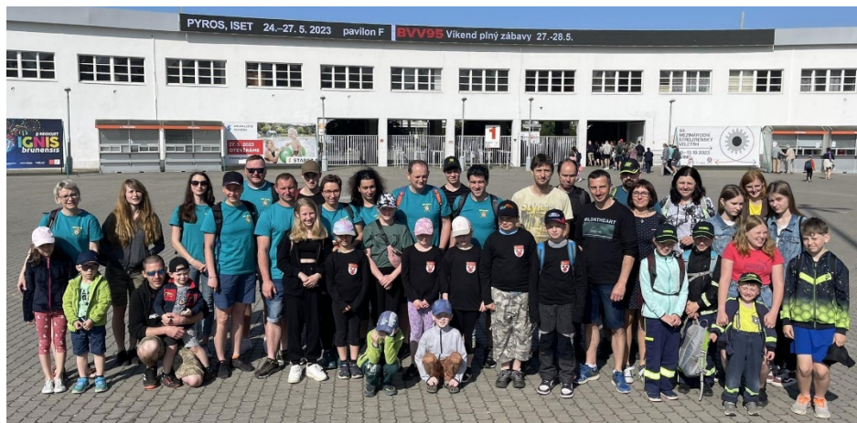
Hasičský výlet pro děti i dospělé - BVV Brno (27. 5. 2023)