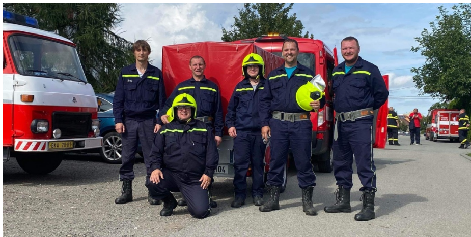
Oslavy 150. výročí založení SDH Knínice - předávka vody (2. 8. 2023)