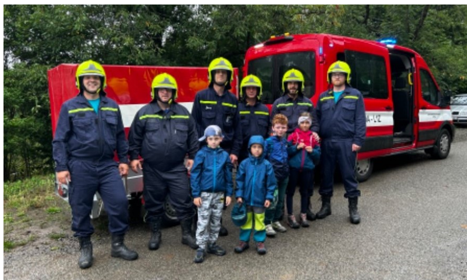
Oslavy 145. výročí založení SDH Uhřetice - předávka vody (5. 8. 2023)