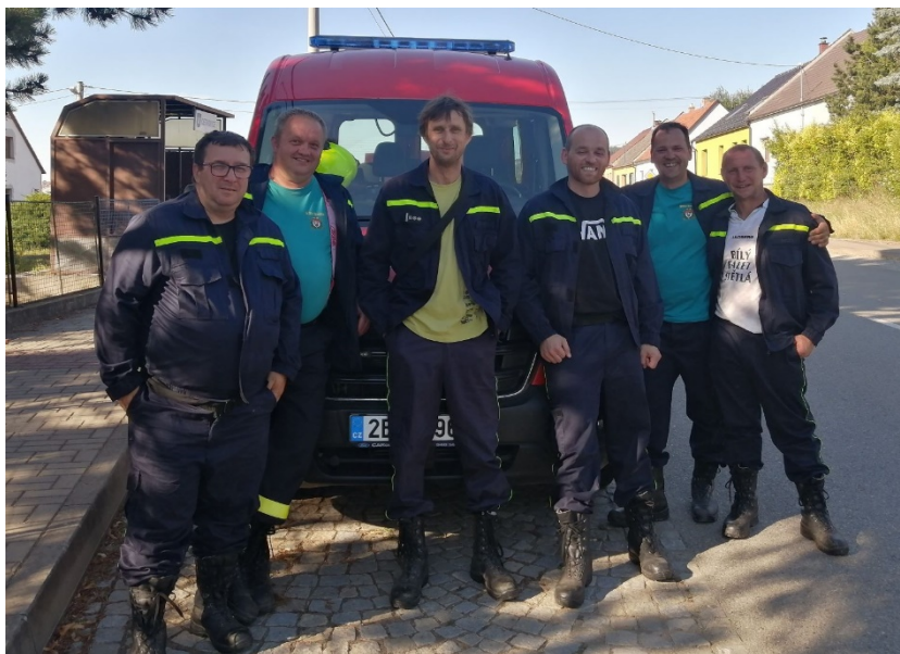
Předávka vody - Hasičský výlet v Cetkovicích (15. 7. 2023)