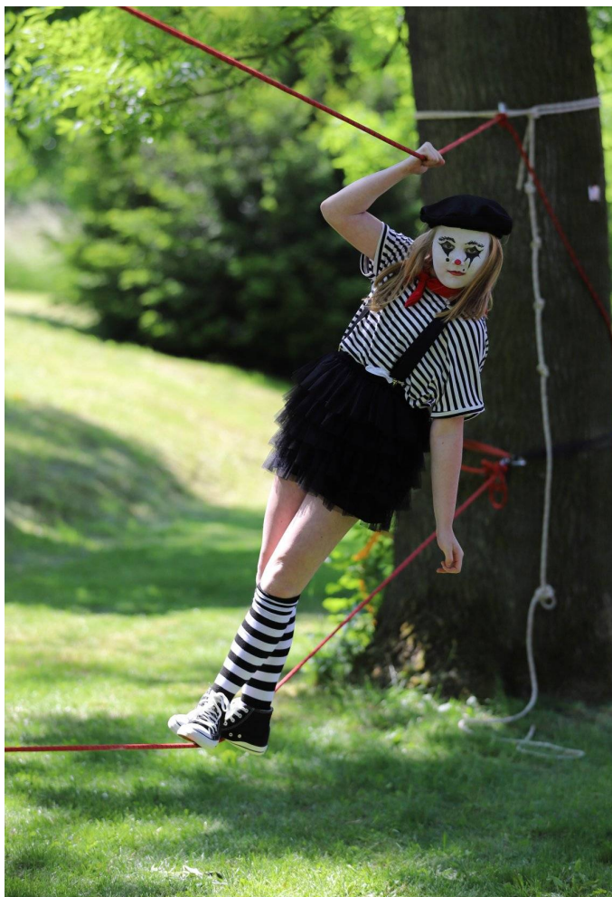
Dětský den Hurá do cirkusu (3. 6. 2023)