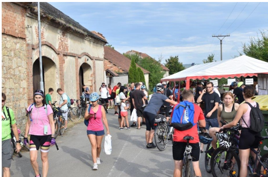
Cyklovýlet OKOLO MALÉ HANĚ - zahájení starostů a registrace v Cetkovicích (26. 8.)